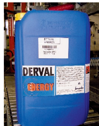
Weniger Waschtemperatur: Neu im Kreussler Sortiment ist der Waschkraftverstärker Derval Energy.

onswaschverfahren mit Trebon SI oder Derval Solo plus Ottalin Peracet (RKI-Listung für Bakterien und Viren nach § 18 IfSG) bei 60°C und zehn Minuten Einwirkdauer empfehlen die Wiesbadener Derval Energy im Vorwaschbad einzusetzen. Außerdem kann Derval Energy auch als fettlö-